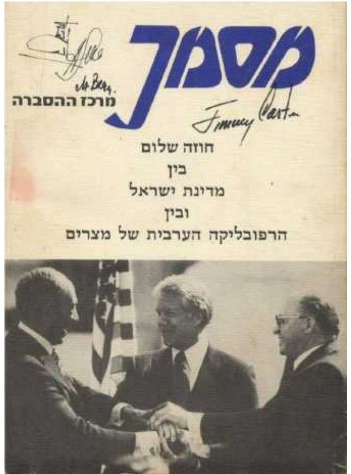
طابع بريد أصدرته هيئة البريد الإسرائيلية بعد توقيع معاهدة السلام بين مصر وإسرائيل ويحمل صورة المصافحة الثلاثية بين كارتر وببجين والسادات في كامب ديفيد